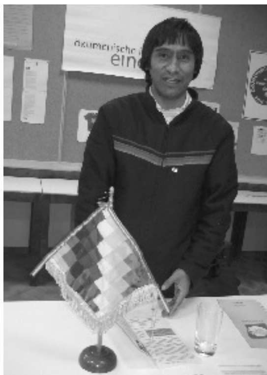
Der Botschafter hinter der bunten Fabne der indigenen Völker Boliviens („Wiphala“)

Die Sichtweisen der indigenen Kulturen und sozialen Bewegungen werden von der Regierung wichtig genommen und