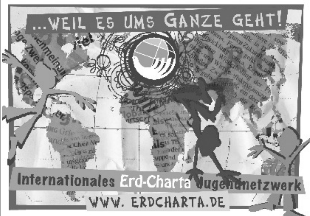
Diese Postkarte (die es auch als Banner u.a. gibt) wirkt eigentlich nur in ihren vielen bunten Farben. Allein dafür lohnt sich ein Blick auf die dort angegebene Internet-Seite!

Es geht uns um Vernetzung innerhalb des offenen, in rund 40 Ländern aktiven