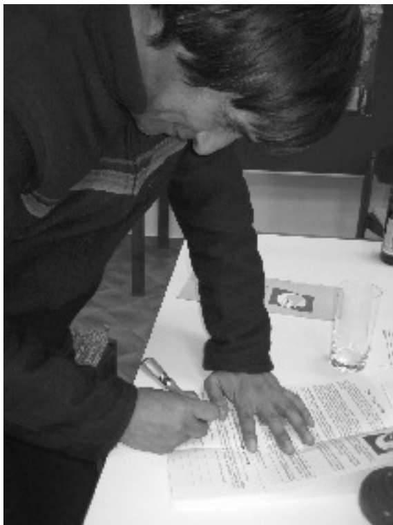
... und beim Unterschreiben der Erd-Charta

meisten Betroffenen sind die Ärmsten, die Entwicklungsländer, die zukünftigen Generationen und unsere Mutter Erde.